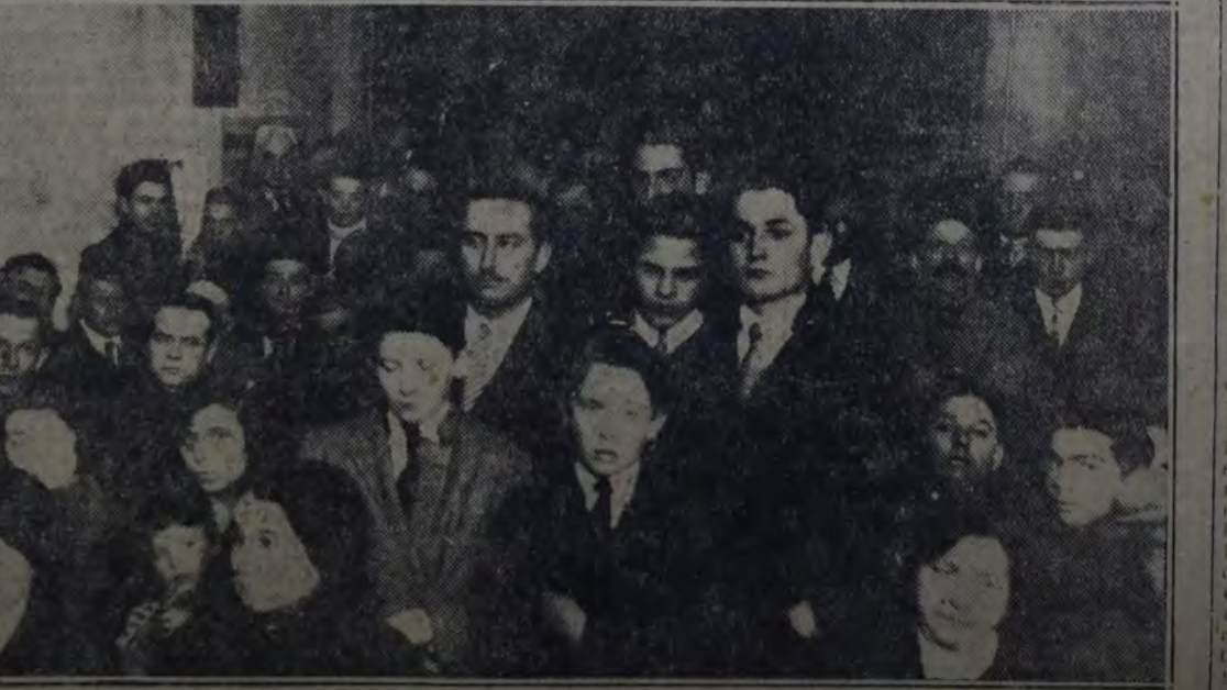
EN EL CENTRO SOCIALISTA DE LA SECCION 15a. (LA PATERNAL), DURANTE EL IMPORTANTE ACTO DE ANOCHE.